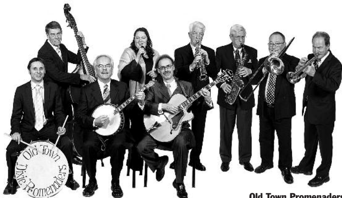
Old Town Promenaders